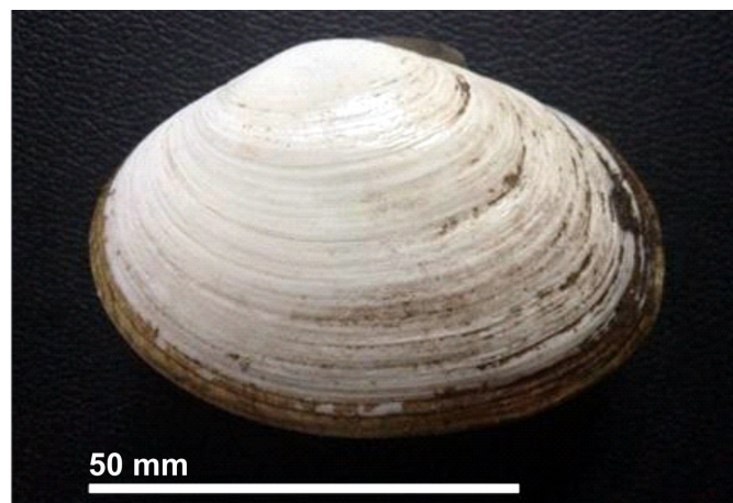
Figura 1. Vista lateral de G. solida . Ejemplar obtenido en Punta Chocoy, Carelmapu (41°44' S; 73°42' O).

Gari solida , conocida vernacularmente como "culengue", presenta una concha relativamente gruesa, oval-redondeada, inflada, truncada oblicuamente hacia su porción posterior y está revestida, junto a los bordes, por un periostraco de color parduzco (Osorio, 2002). La longitud aproximada de la concha alcanza hasta 100 mm (Jerez et al. , 1999). El extremo anterior es más corto, anguloso y hacia él se desplazan levemente los pequeños umbos. Externamente la concha tiene un color blanco y posee finas estrías concéntricas que se engrosan hacia el extremo posterior (Fig. 1), el ligamento es alargado y está ubicado tras los umbos.